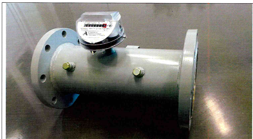
Рисунок 2- Внешний вид счетчика без масляного насоса